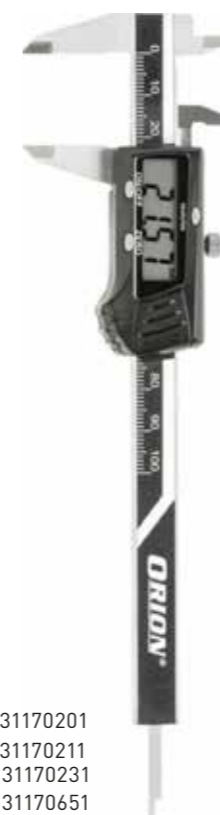
Арт. 31170201 Арт. 31170211 Арт. 31170231 Арт. 31170651